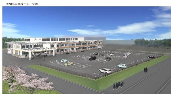
天間林中学校完成イメージ図

天間林中学校の場所は、天間館中学校と榎林中学校のほぼ中間地点、現在の天間林運動公園内駐車場に校舎が新築されます。新校舎は、現天間林体育館に渡り廊下でつながり、駐車場については、外構工事によって校舎北側に整備されます。