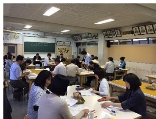
話し合った内容を発表する教職員

6月4日、天間館中学校と榎林中学校の教職員が集まり、第1回の「学校運営部会」と「教材備品部会」が天間館中学校で開催されました。