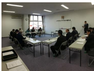
第1回準備委員会の様子