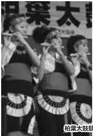
柏葉太鼓競演会の様子

4日間のまつり期間中、催し物や多くの露店にぎわい、訪れた観客らは、まつりのお囃子とともに過ぎていく、七戸の短い秋を満喫しました。