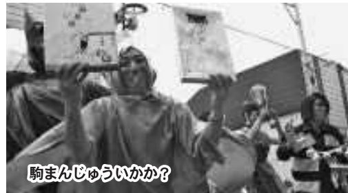
駒まんじゅういかか?