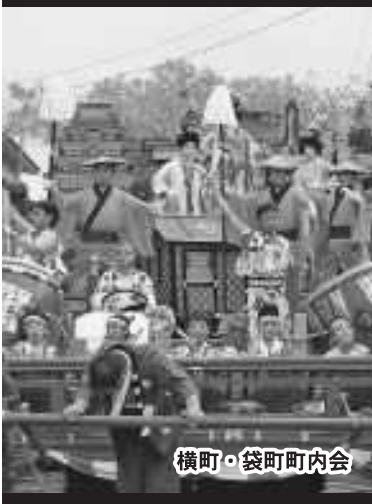
横町・袋町町内会