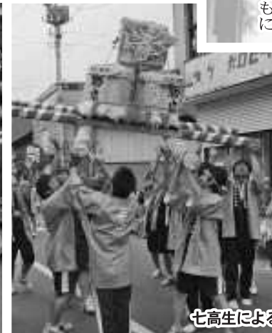
七高生によるみこしと流し踊り