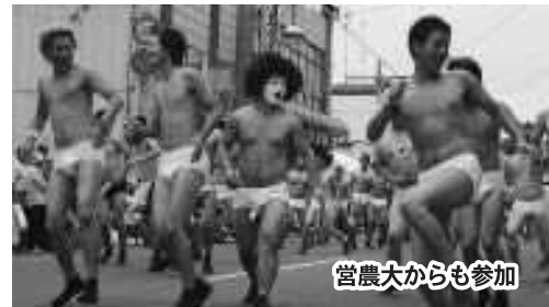
宮農大からも参加