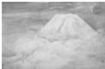
本展出品 (ヤマタネコレクション) 奥村土牛「聖」昭和58年