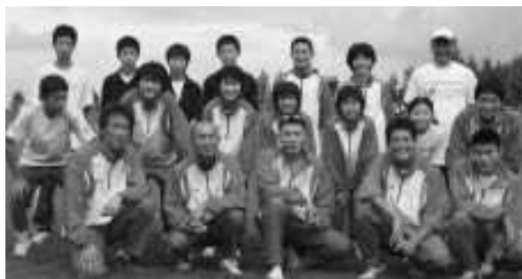
平成20年度 七戸町選手団

町選手は、上位チームとデットヒートを展開し、昨年の8位を上回る町の部5位、総合12位と健闘しました。