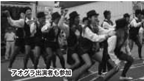
アオグラ出演者も参加