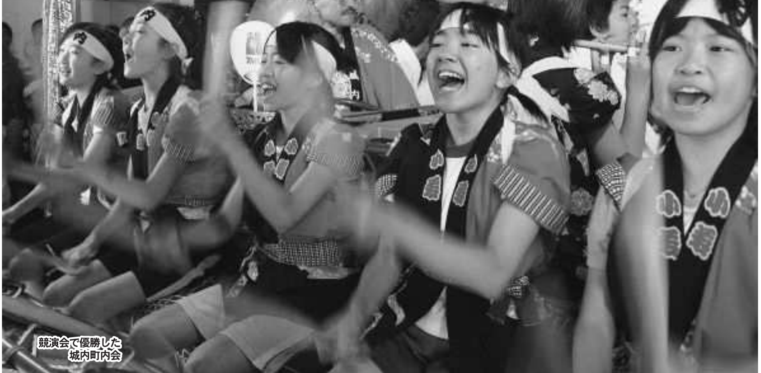
競演会で優勝した 城内町内会