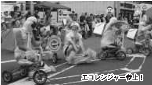
エコレンジャー参上!