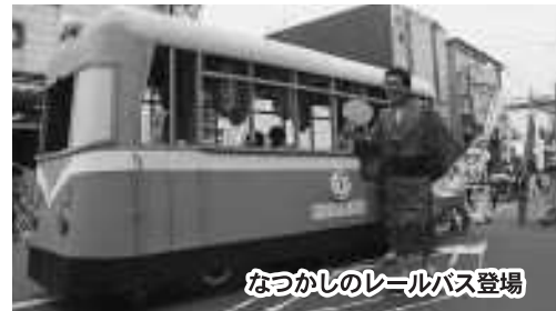
なつかしのレールバス登場