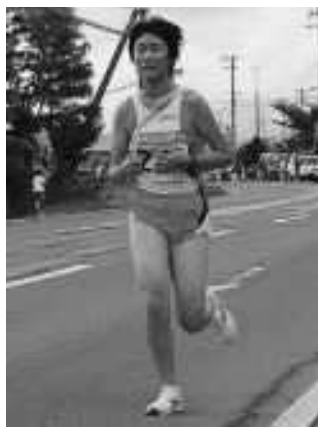
大会当日、7区に抜擢された高西選手の力走