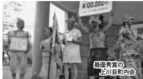
最優秀賞の 上川目町内会