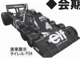
6輪のF1がやってくる!

世界を魅了したタミヤのプラモデル、ラジオコントロールモデル、ミニ四駆など子どものころから慣れ親しんだ模型が会場を埋め尽くします。