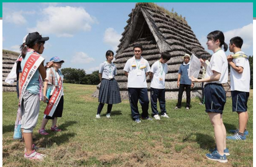
▲七戸高校生のガイドを受ける児童

世界遺産対策室は7月30日・7月31日・8月3日の3日間、町内の小学4年生から中学3年生を対象に、二ツ森貝塚ジュニアボランティアガイド養成講座を開催しました。参加した子どもたちは、二ツ森貝塚の出土品の見学や町内の猪ノ鼻(1)遺跡の発掘現場の見学、七戸高校の生徒による二ツ森貝塚のガイドを通して、二ツ森貝塚や縄文について学び、「今回知ったことを見に来た人に伝えて楽しんでもらいたい。そして、来てくれた人から広まってたくさんの観光客にきてほしい」と話していました。