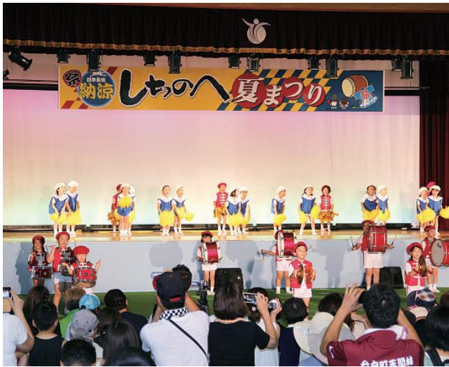
▲来場者を魅了した道ノ上こども園の園児たち

七戸町中央公園屋内スポーツセンターで8月16日、第13回しちのへ夏まつりが行われ、町内外からの多くの来場者でにぎわいました。八甲田太鼓によるダイナミックな演奏をはじめ、こども園や文化団体によるステージ発表や歌謡ショーで会場は大盛況。雨天のため翌日開催となった花火大会では、1,700発の大輪の花が夜空を彩り、夏を締めくくりました。