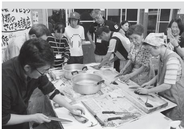
▲魚をさばく参加者たち