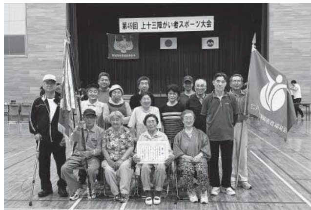
▲2連覇を果たした七戸選手団

十和田市総合体育センターで7月13日、第49回上十三障がい者スポーツ大会が行われ、9市町村が5種目で競い合いました。七戸町選手団は、息のあったチームワークで玉入れ・サッカーリレー・魚釣りリレーの3種目で1位を獲得。総合優勝し2連覇を成し遂げました。