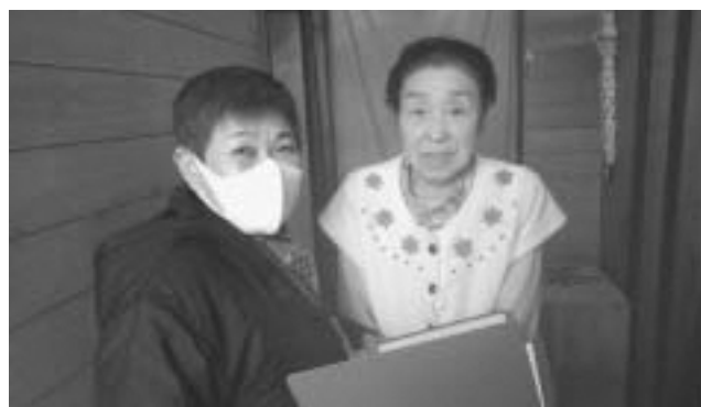
▲高齢者宅へ訪問し安否確認している様子

現在、二ツ森地区は欠員中ですので、同地区にお住まいで民生委員に関心のある方や、地区の民生委員・児童委員について聞きたい方は社会生活課までお問い合わせください。