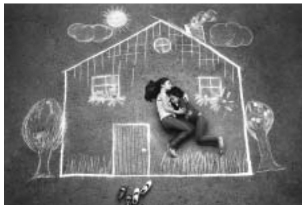
EARTHQUAKE AND LONELINESS(地震と寂しさ) 作者:LEYLA EMEKTAR(トルコ)