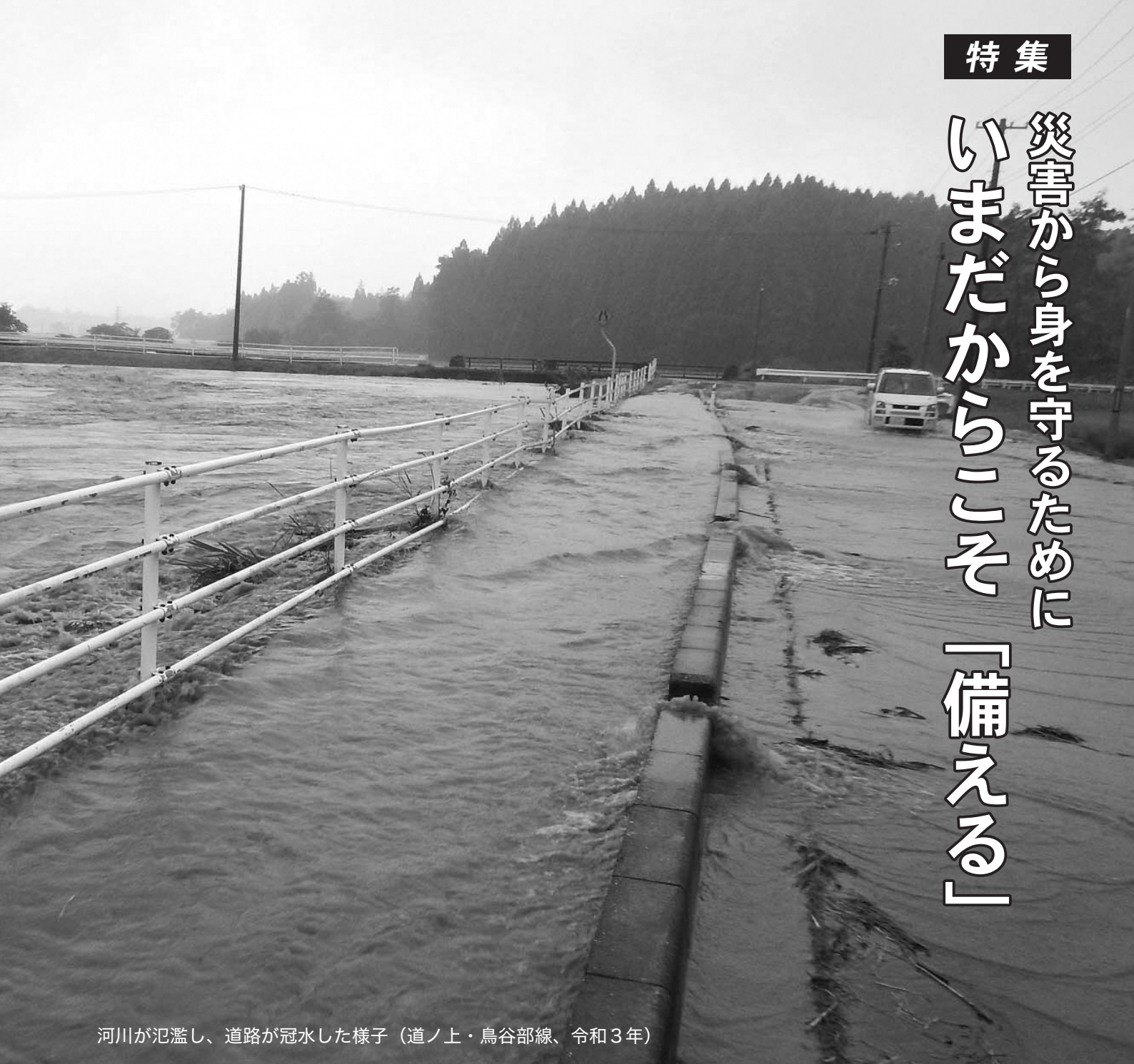
河川が氾濫し、道路が冠水した様子（道ノ上・鳥谷部線、令和3年）

全国各地で局地的な集中豪雨の発生が増加しています。昨年の8月に発生した台風第9号から変わった温帯低気圧の影響による大雨では、七戸町でも河川の一部が氾濫し、道路が冠水するなど甚大な被害を受けました。災害はいつ発生するか分かりません。普段からもしもの事態に「備える」ことが大切です。これを機に、自身や家庭での防災対策についてチェックしてみましょう。