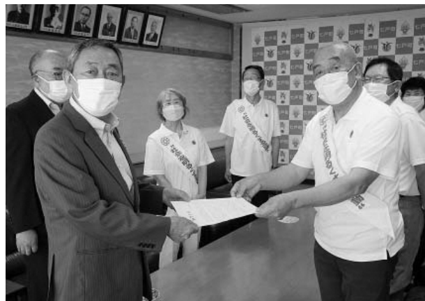
▲小又町長にメッセージを伝達する七戸町保護司会の皆さん