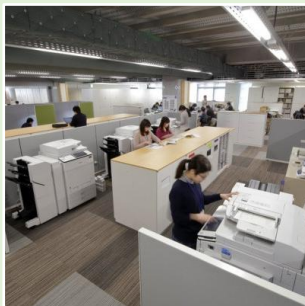
部門共用化により台数やスペースの無駄を省いたコピーコーナー