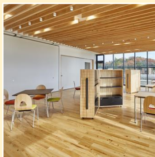
木を多用したぬくもりのある空間