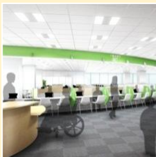
車いす利用者でも利用しやすいバリアフリーに配慮した窓口

空間イメージ ※詳細については、今後の検討および関係機関との協議を踏まえ設計いたします。