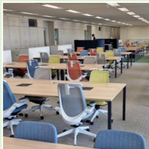
部門間の交流がしやすいオープンな執務スペース

空間イメージ ※詳細については、今後の検討および関係機関との協議を踏まえ設計いたします。