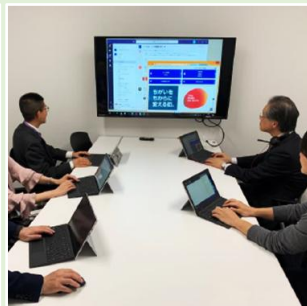
ペーパーレスな会議を支えるモニターなどの会議室設備（渋谷区HP）