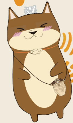
オリジナルキャラクター 「しえり〜め」