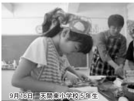
9月16日 天間東小学校5年生