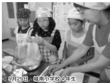
9月29日 城南小学校4年生