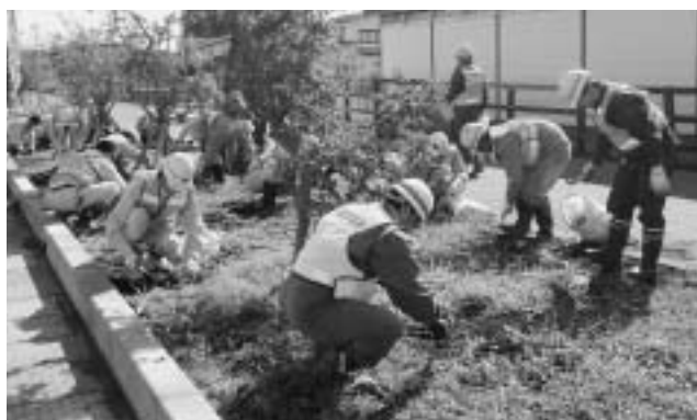
▲B-1グランプリ来場者をきれいな景観で迎えるため美化活動に従事して下さった関係者の皆さま

※「建設経営研究会」とは、県建設業協会上北支部の会員会社のなかで、社長以外の若手経営者によって組織されている団体です。