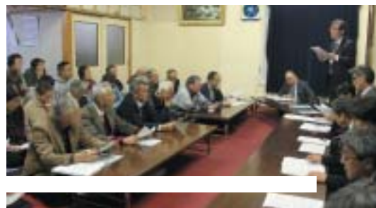
昨年開催された新町町内会出前座談会の様子

あなたの町内会・分館などに、 町長と行政担当者が 出向いて お悩み・ご要望をお聞きします！