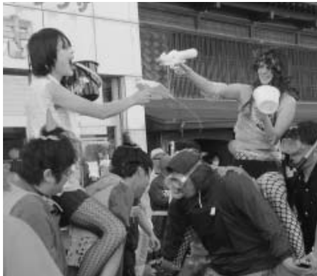
▲七戸女性のたくましさをもPRした「ドキッ!!女だらけの騎馬戦」