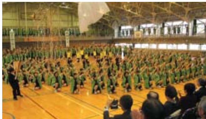
▲トラジョサンバが披露された記念アトラクション