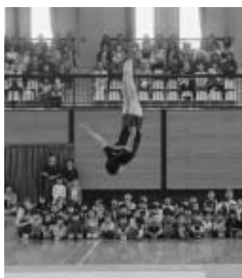
▲青森山田高校新体操部の大技を鑑賞した親子ふれあい体操演技会

天間林体育館で9月26日、町教育委員会主催の親子ふれあい体操演技会が開催されました。町内の園児や保護者は、青森山田高等学校新体操部による全国トップクラスの演技を鑑賞しました。また、園児は補助付きで前方宙返りに挑戦するなど、会場は大盛り上がりでした。