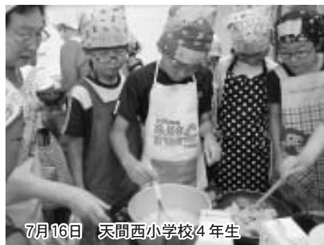
7月16日 天間西小学校4年生