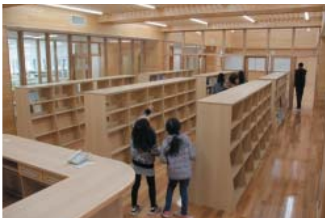
▲2日間限定で一般開放された天間林中学校内覧会

天間林中学校（天間林運動公園敷地内）で2月18・19日の両日、校舎の内覧会が開かれ、入学予定の子どもたちやその家族などが多く訪れました。校舎は鉄筋コンクリート造2階建てで、床や壁などの内装は木を基調としており、不審者の侵入を防ぐための防犯カメラも設置されています。来訪者は「外観と違い、中には木がふんだんに使われていてびっくりした」と話していました。