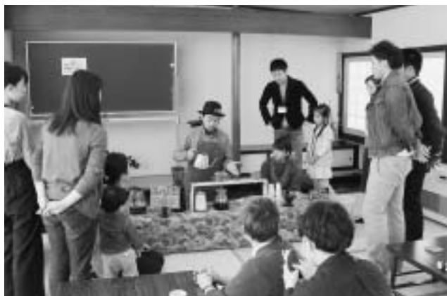
▲コーヒーのおいしい入れ方を教わる参加者たち

七戸南公民館で2月12日、若者の社会参加や若者間の交流を目的にコーヒースクールが開かれ、町内に住む20代～30代の10人が参加しました。平成28年度七戸町若者の拠点づくり事業の一環として行われたもので、参加者は、講師からコーヒーの基礎知識について学んだほか、グループに分かれておいしい入れ方を実践するなどして交流を深めていました。