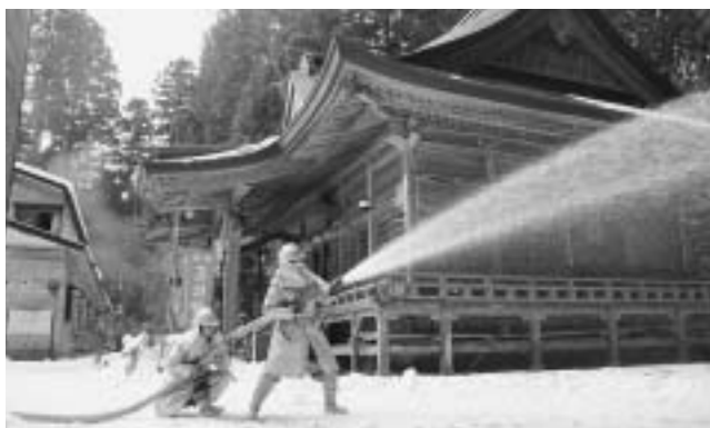
▲地域住民・消防関係者連携で行った文化財防火訓練

花松神社で1月27日、地域住民や消防関係者が参加して、文化財防火訓練が行われました。文化財防火デーの一環として、この時期全国的に行われるもので、今回は花松神社の火災を想定し、地域住民による119番通報訓練のほか、消防署員や消防団による放水・救助訓練が行われました。また、訓練終了後には、地域住民が水消火器で消火体験を行い、火災に備え使い方を再確認しました。