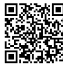
ひとり親世帯以外 給付金サイト