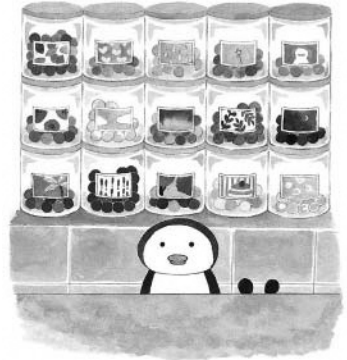
ゆめぎんこう © aki kondo