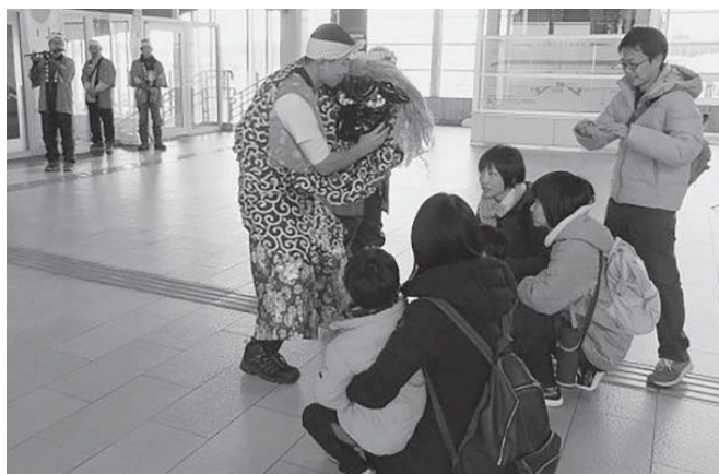
▲頭を噛んでもらう新幹線利用者の方々

※神楽や郷土芸能に興味があり、参加したい方は七戸町教育委員会世界遺産対策室（☎58-5530）にご連絡ください。