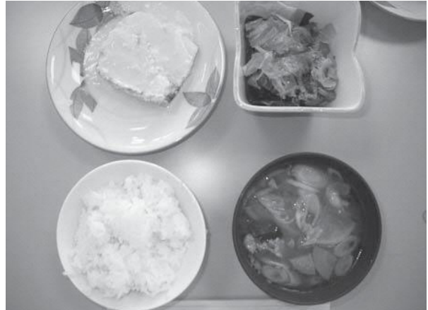
▲基本レシピ：ほうれん草のお浸し 減塩レシピ：さばのミルクみそ煮 ケチャップ豚汁