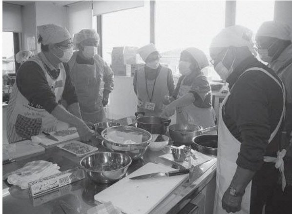
▲手順を確認しながら実習中

単身生活や料理をする機会の少ない男性の自立支援と社会参加を目的に、町老人クラブの男性を対象とした料理教室を開催しました。調理実習をとおして献立の組み合わせ方や材料の切り方、減塩のコツを楽しく学ぶことができました。参加者には、自宅でも実践して家族や地域の人にもバランスのよい食事を伝えるよう声がけしています。今後は働き盛りなど若い世代に対しても取り組みたいと考えています。