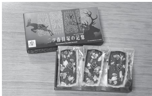
▲完成した「ニツ森貝塚の記憶」