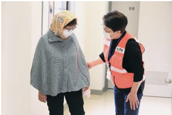
▲声かけの模擬訓練をする参加者

6月16日、ふれあいセンターで民生委員等を対象に、地域で認知症高齢者に遭遇した場合どのように接するべきかを学ぶ認知症高齢者等徘徊模擬訓練が行われました。