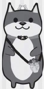
ニツ森貝塚キャラクター しえり～ぬ

今月から2か月に一度、町内の文化財を紹介することになりました。 皆さんの知らない文化財があるかもしれませんので、楽しみにしてください。