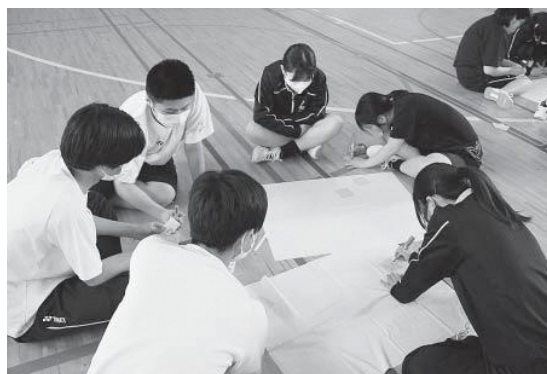
▲ストレスへの対処法についてグループで協議する生徒たち

生徒は、「嫌なことがあったら相談できる場所があるので、1人で抱え込まずに相談したい。」と話していました。