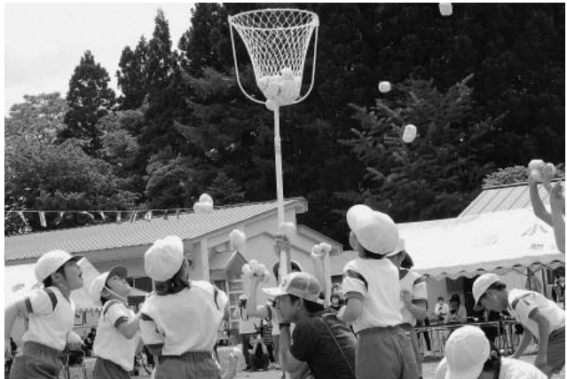
▲城南小学校 玉入れ