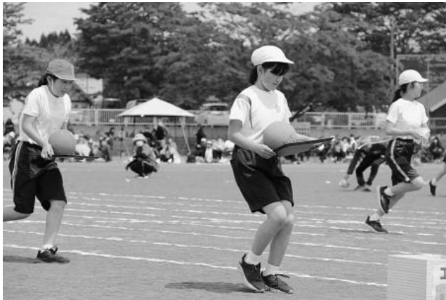
▲天間林小学校 技能走