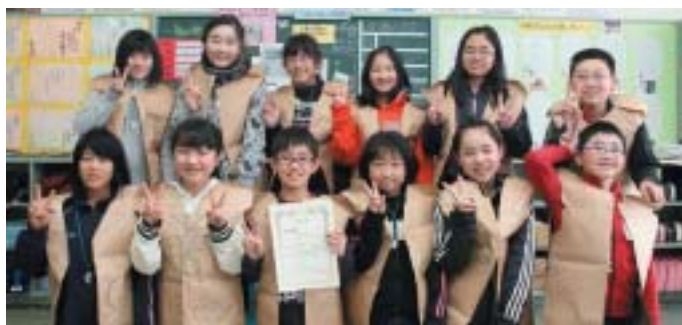
▲最優秀賞を受賞した天間東小学校5年生の皆さん