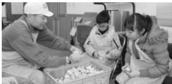
▲にんにくの皮むきを教わる子どもたち

参加した6人の子どもたちは、(福)求道舎おおぼこ作業所で、知的障がい者の方々の仕事として行う、にんにくの皮むきや電子部品ならべに挑戦。「単純作業だったけれど、集中してやり続けるのは大変だと思った。知的障がい者の人たちが集まって働く場所があるのは知らなかった」と、話していました。