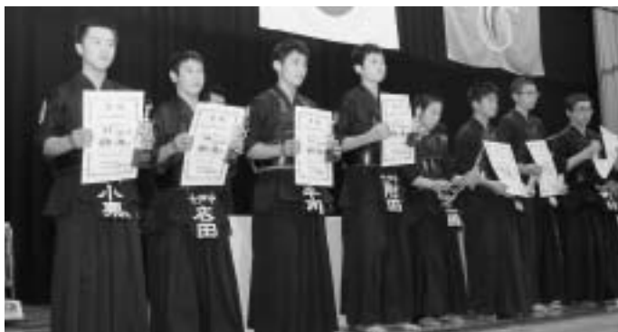
▲七戸中学校の剣士たちが大活躍した剣道大会

1月24日・25日の両日、天間林剣道大会兼宮崎杯高等学校剣道選手権大会が天間林体育館で行われました。30回目を記念する今大会には、県内の小・中・高校生合わせて約370人が参加。小学生から高校生までの12部門で、日ごろの練習の成果を競い合いました。