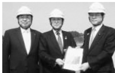
▲石井大臣に要望書を手渡す小又町長と蛭名東北町長(左)

石井啓一国土交通大臣が4月22日、一般国道45号上北自動車道の上北天間林道路と天間林道路を現地視察しました。小又町長と蛭名鉦治東北町長が石井大臣に整備促進を求める要望書を手渡しました。