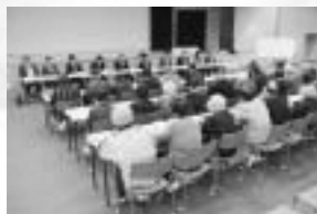
七戸町ゲートボール協会出前講座会 (屋内スポーツセンター)

町内会、分館など10人以上の参加があれば申し込みできます。 企画調整課(☎68-2940)にお問い合わせください。