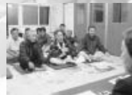
貝塚自治会出前講座会 (ふれあい館貝塚)