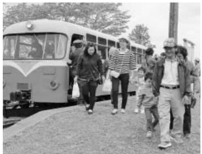
▲乗車を終え笑みをこぼす来場者たち

旧南部縦貫鉄道七戸駅構内で5月4・5日、（一社）南部縦貫レールバス愛好会（星野正博代表）がレールバスとあそぼう2018を行いました。イベントには町内外から訪れた鉄道ファンや家族連れが来場し、体験乗車や走行中の写真を撮るなどして楽しみました。レールバスに乗った方からは笑顔がこぼれていました。