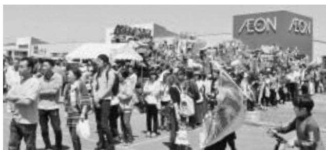
▲各店自慢のピザを求め来場者が行列をつくった 第7回ピザカーニバルin七戸

爽やかな晴天の下、10チームがそれぞれ試作を重ねた自慢のピザを味わおうと多くの人で行列ができ、中には40分待ちの列もありました。人気投票では、「しんまちPIZZAぶ」のスライス豚タン入りスパイシーピザ「Tan de PIZZA」がチャンピオンに輝き、2連覇を果たしました。