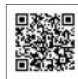
生活支援 特別給付金ページ

詳しくは、七戸町ウェブサイト（ http://www.town.shichinohe.lg.jp/ ）をご覧ください。