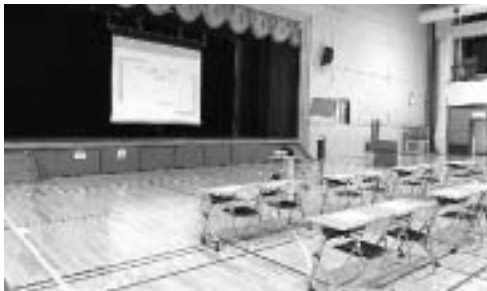
▲七戸高校説明会会場(天間林中学校)の様子

この柏葉塾は七戸高校の敷地内にあることから、高校の先生方と生徒の進路関連、英検や漢検の受検状況、各教科の指導内容の役割分担などの情報交換を定期的に行っています。