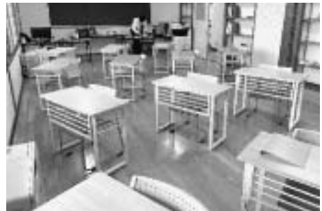
▲個別指導室の様子

公設民営塾とは、市町村などの自治体から依頼を受け、民間企業が運営する学習塾のことです。柏葉塾は七戸高校のさらなる魅力化のため、七戸町から委託を受けて昨年10月に開校しました。