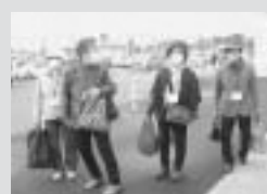
買い物後、バスを待ちながら会話を楽しむ体験者

★コミュニティバスの利用体験に興味がある方はお手伝いしますので、地域包括支援センター（☎68-3500）までご相談下さい。