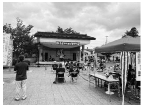
▲シチノヘオトマツリでは塾生が受付ボランティアを行いました。

七戸高校生への学習サポートだけでなく、町内や町外の中学校への高校説明会に同席したり、七戸公営柏葉塾の体験会で中学生の学習サポートを行ったり、もちろん町内のイベントに参加したり町内企業への挨拶など行っています。7月24日にイベント広場を会場に開催された「シチノヘオトマツリ」には、3名の塾生がボランティアとして参加させていただき、町の賑わい創出に一役買いました。今後も私も塾生もつながりや絆を大切にさせていただきます。