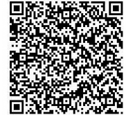
4回目接種券発行申請ページ (新型コロナウイルス感染症)

※2、3に該当される方は接種券発行申請が必要です。接種を希望される場合は保健福祉課までお問い合わせいただくか、右のQRコードを読み込みオンライン申請を行ってください。