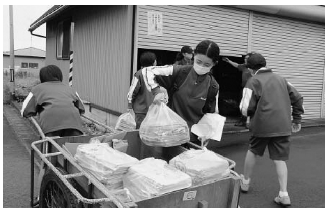
▲協力して回収した古紙をリヤカーに積み込む生徒たち

生徒たちは古紙の回収に協力していただいた家庭や事業所に対して、自作した礼状を添えて感謝の気持ちを伝えていました。