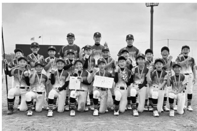
▲県1位の座に輝いた天間林BBCの皆さん

7月23日・24日の2日間、平川市尾上多目的広場および黒石運動公園野球場で第53回青森県少年軟式野球大会が開催されました。本大会には県内各地で予選を勝ち抜いた小学校の部15チーム、中学校の部13チームが出場し、練習の成果を競い合いました。