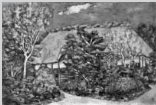
▲鷹山宇一「盛田牧場・南部曲家」(1930年頃、キャンバス・油彩、12号)

「現代日本の稀有な幻想画家」と称された、洋画家・鷹山宇一の初期から晩年にいたる、油彩・素描・木版などにより、その画業を紹介します。