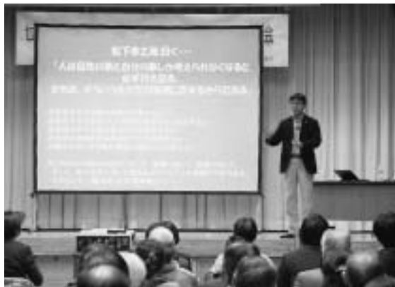
▲他県や他国の事例を交えて講演する山田さん

山田さんは、「七戸町・七戸十和田地域におけるこれからの観光とは～『らしさ』と『ならではの』による人を呼び寄せる仕組みづくり～」をテーマに、様々な事例やデータを交えながら「七戸町民が脈々と育んできたライフスタイルの豊かさを大切にしなければ人はやってこない」「今だけ、ここだけ、あなただけのおもてなしが必要」と話し、七戸町も十分な誘客ができる素材があると講演しました。