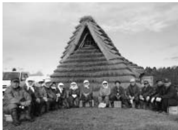
二ツ森貝塚保存会の皆さんと竪穴住居

に選定されませんでした。私たちの心の拠り所である二ツ森貝塚を後世に伝えていきたい」と切実に語っていました。