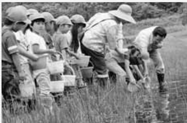
イワナの放流をする保育園児たち