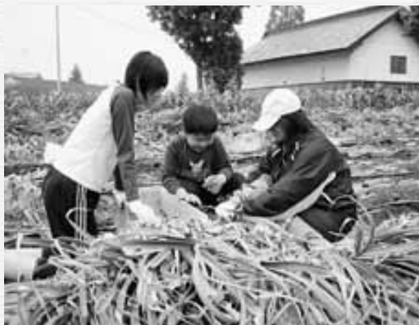
楽しそうにニンニクの収穫を行う親子

収穫体験をした参加者たちは、「ニンニク生産の一部を知ることができて良かった」「またこのような体験に参加してみたい」などの感想を述べていました。