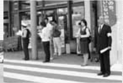
←「みなさんで、あいさつをしましょう」と呼びかける関係者