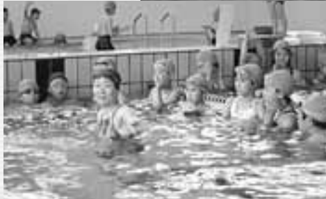
← ↑ 真剣に水泳の授業に取り組む児童たち