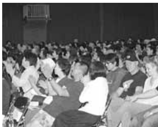
上映後、会場からは拍手が沸き上がった

映画「アオグラ」は2006年9月23日⑦より青森松竹アムゼ・八戸フォーラム・シネマヴィレッジ8イオン柏にて先行上映され、その後全国で公開される予定になっています。