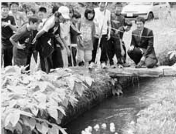
導水路を使った「アヒルレース」で歓声をあげる児童たち