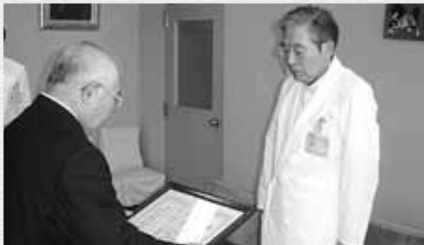
↑管理者より感謝状を受け取る大黒院長