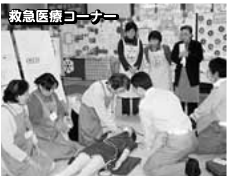
救急医療コーナー