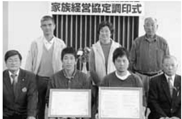
家族経営協定を結んだ2組の農家及び関係者