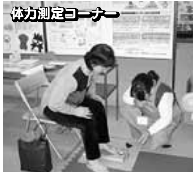
体力測定コーナー