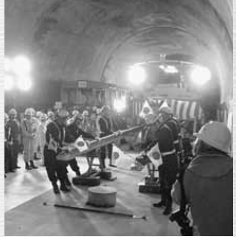
↑八甲田トンネル内敷設第1号となったレール

今回敷設されるレールは、長さ25メートル、重さは1.5トンを8本溶接でつなげた全長200メートルのロングレール。平成21年度末までに、八甲田トンネル市ノ渡入口から、中間地点まで13.2㎞にレール敷設をすることとしています。