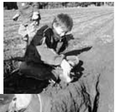
上手に掘れると 喜びも大きい

かだれ天間林田舎体験の会では来年2月に、かまくら作りや馬そりを楽しむ「雪国体験」を予定しています。