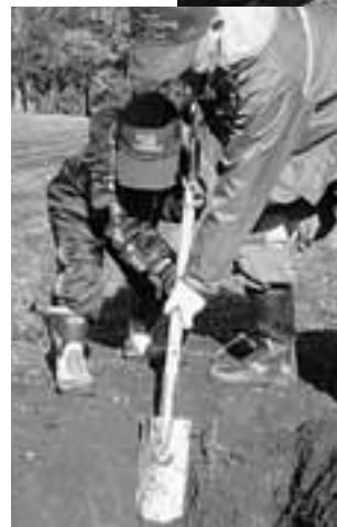
祖父と孫が一緒に 収穫に汗を流す