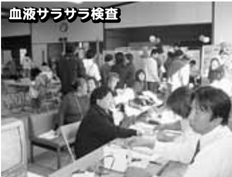
血液サラサラ検査

また、来場者からは「体験コーナーで測った後の指導も丁寧にしてもらえて良かった。普段の食生活の大切さが分かった」「毎年開催して欲しい」との感想が寄せられていました。その他、今年度より消防署と協力し、救急医療展を同時に開催しました。たくさんの方々が心肺蘇生法を体験し「とても良かった」とこちらも好評でした。