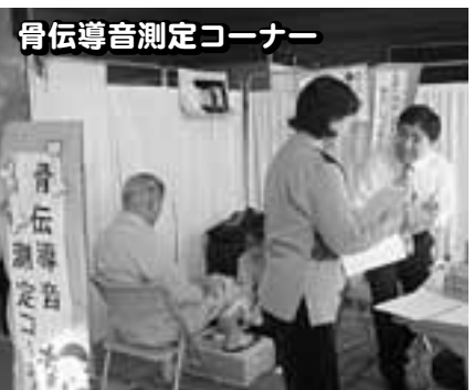
骨伝導音測定コーナー