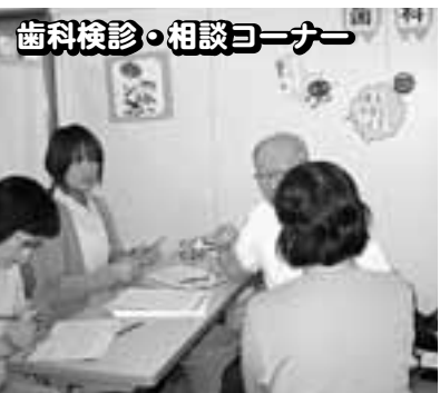
歯科検診・相談コーナー