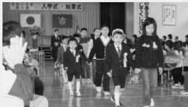
在校生に祝福される新1年生の児童ら