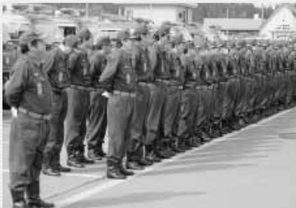
防火パレードの出発式に臨む町消防団員ら