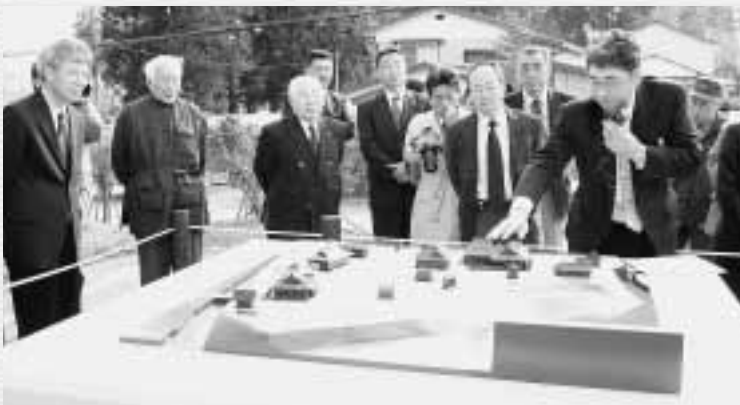
復元したジオラマについての説明を受ける参加者ら

国史跡・七戸城跡の北館地区で中世ごろに存在した御殿を復元した模型（ジオラマ）が東日本鉄道文化財団の支援を受けて完成し、3月28日、同地区にて除幕式が行われました。