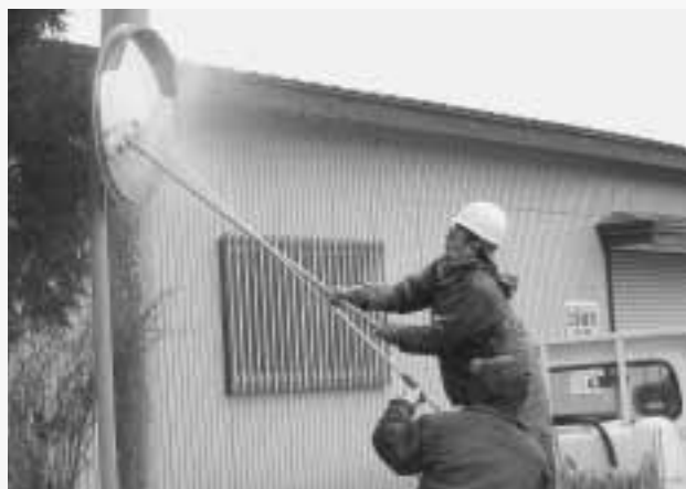
七戸町交通安全協会によるカーブミラー清掃 (平成19年4月実施)