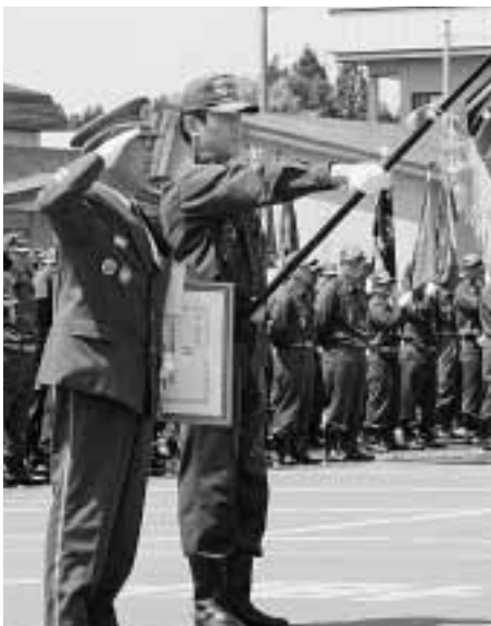
消防庁長官表彰を受けた七戸連合消防団

その後に行われた玉落とし競技では、代表団員らが地上9メートルに設置された玉を的確に落とし、日頃の訓練の成果を発揮しました。