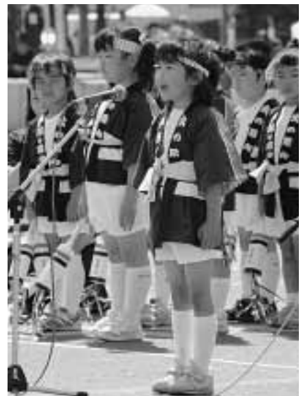
元気よく防火の誓い