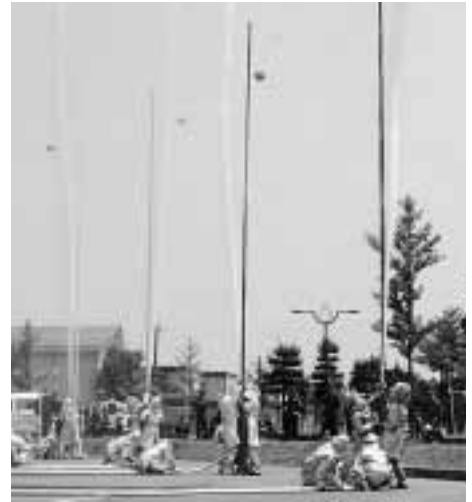
玉落とし競技の様子