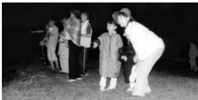
ホタルが光るたびに参加者からは歓声が上がった