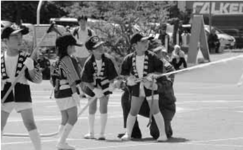
消火活動は幼年消防クラブにおまかせ！ミニ操法の様子