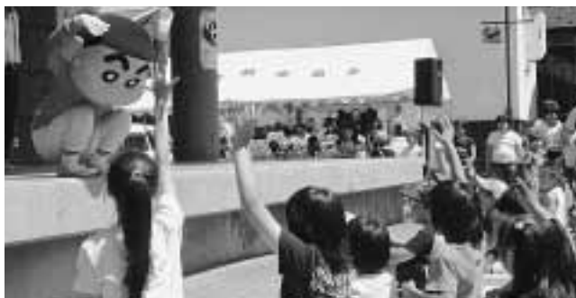
クレヨンしんちゃんに大はしゃぎの子どもたち

毎年恒例となった七戸町商工会主催の「七」の日イベントが7月7日、中央商店街イベント広場で開かれ、家族連れなど多くの来場者でにぎわいました。当日会場には、保育園児らが作成したたくさんの絵馬が飾られ、その他、地元の各団体によるフリーマーケットやお馴染みのクレヨンしんちゃんショーなどで会場は大いに盛り上がりました。