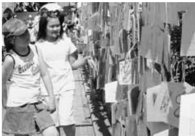
たくさんの絵馬が展示されたイベント広場