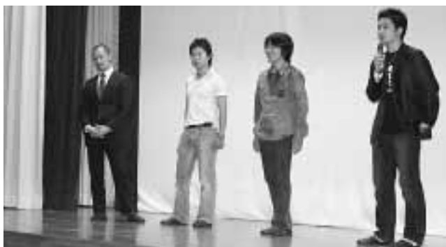
「アオグラ」出演者が舞台あいさつ