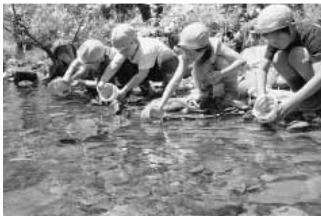
バケツいっぱいのイワナを和田川に放流する園児たち

当日は天気に恵まれ、生後5ヶ月で体長5㎝になったイワナの稚魚が、自分のバケツに配られると、園児たちは興味津々。2つのグループに分かれて「大きく育ててね」などと呼びかけながら約1万匹を和田川上流に放流しました。