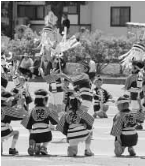
園児らによるお遊戯