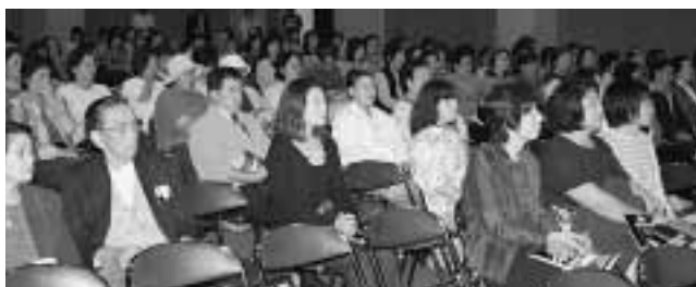
多くの映画ファンが来場しました

毎年恒例となった七戸町商工会主催の「七」の日イベントが7月7日、中央商店街イベント広場で開かれ、家族連れなど多くの来場者でにぎわいました。当日会場には、保育園児らが作成したたくさんの絵馬が飾られ、その他、地元の各団体によるフリーマーケットやお馴染みのクレヨンしんちゃんショーなどで会場は大いに盛り上がりました。