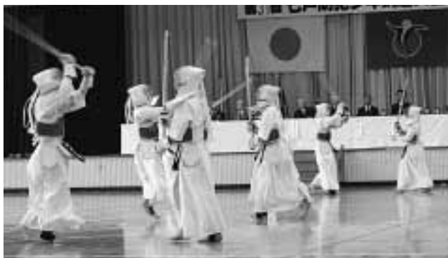
公開模範練成の様子