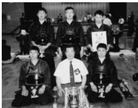
2連覇を達成した剣道競技のメンバー