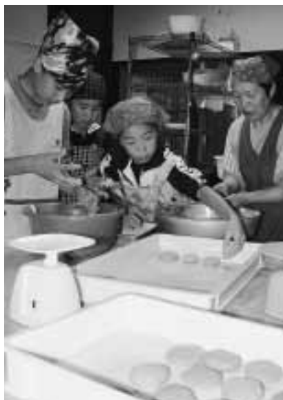
そばもちを作る姿は真剣そのもの