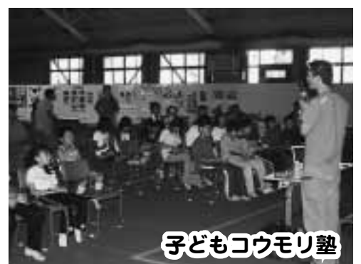
子どもコウモリ塾