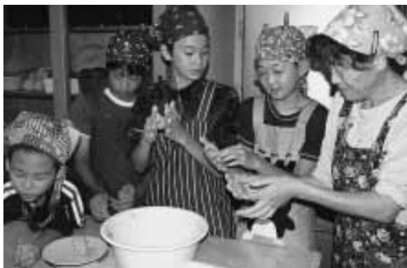
教わりながら楽しく料理