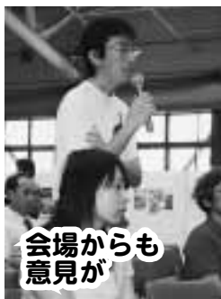
会場からも 意見が

2日間に渡り、研究者とのトークセッションや子どもたちを対象としたコウモリ塾、コウモリ小屋での観察会などが行われ、参加者らは「今まで生態などについて深く考えた事はなかった。触れたことで親近感が沸いた」など、コウモリに深く興味をもった様子でした。