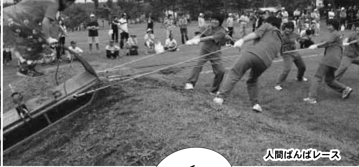
人間ばんばレース