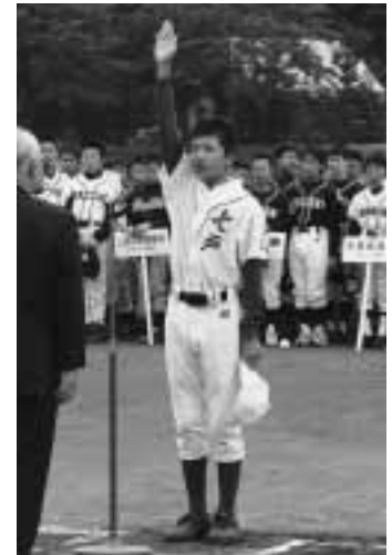
高坂選手による選手宣誓