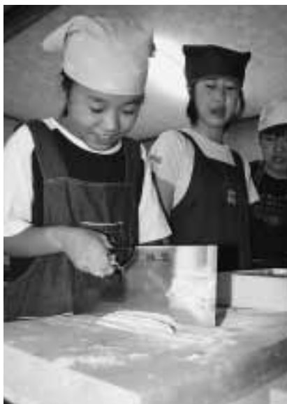
慣れない包丁で一生懸命そばを切る児童ら

でき上がった“そば料理”を試食すると「上手にできた」「初めての割にはうまい」と声上がり、出来栄に満足した様子でした。