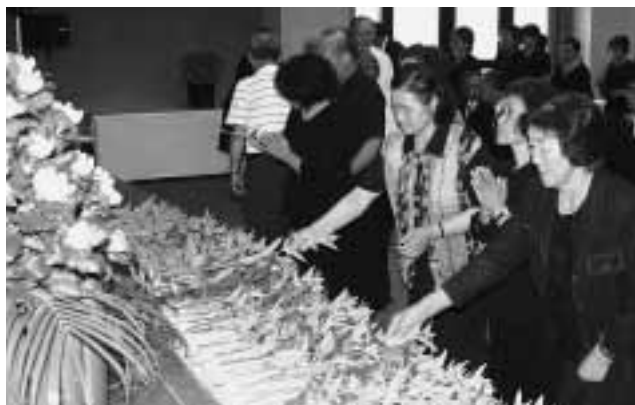
献花の様子。御霊の前で手を合わせる遺族ら