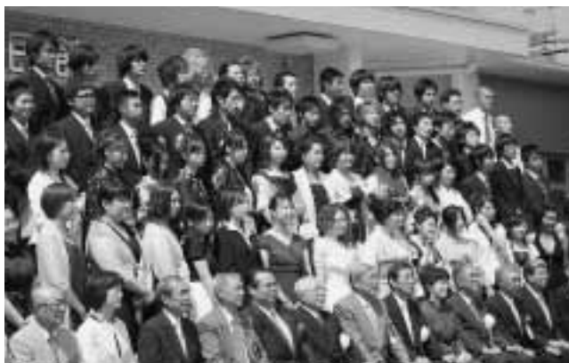
“はたち”の記念に一枚