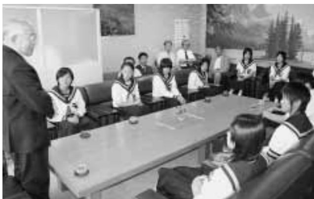
町長から激励を受ける選手たち

青森県中学校体育大会などの県大会に出場し、活躍した町内の中学生が7月27日、福士町長のもとを訪れ、東北大会、全国大会への出場を報告しました。