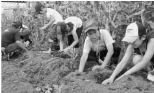
大きなじゃがいもたくさん取れました

普段できない貴重な体験に子どもたちは「収穫って面白い」「この作業はどうやってやるの」と興味津々。汗だくになりながら夏休みの楽しいひとときを過ごしました。