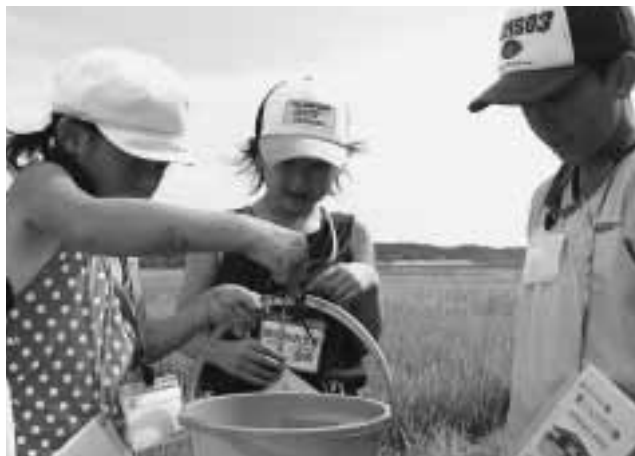
ザリガニ捕れたよ。大きいね！