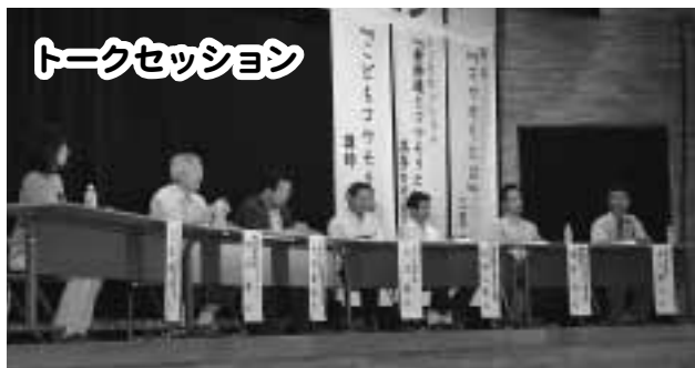
トークセッション