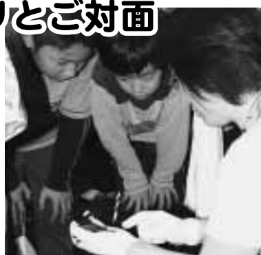
ヒナコウモリとご対面