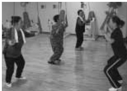
天間林地区で行われている介護予防教室「げんき貯筋(ちょきん)教室」

げんき貯筋教室は、すでに7月から天間林地区の方を対象に週1～2回のペースで開催しています。なお、七戸地区の介護予防教室は特定高齢者の参加の意向が得られ次第、順次開催していく予定です。