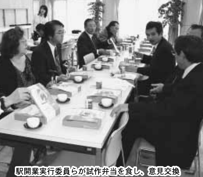
駅開業実行委員らが試作弁当を食し、意見交換