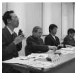
第1回健康増進計画策定委員会の様子