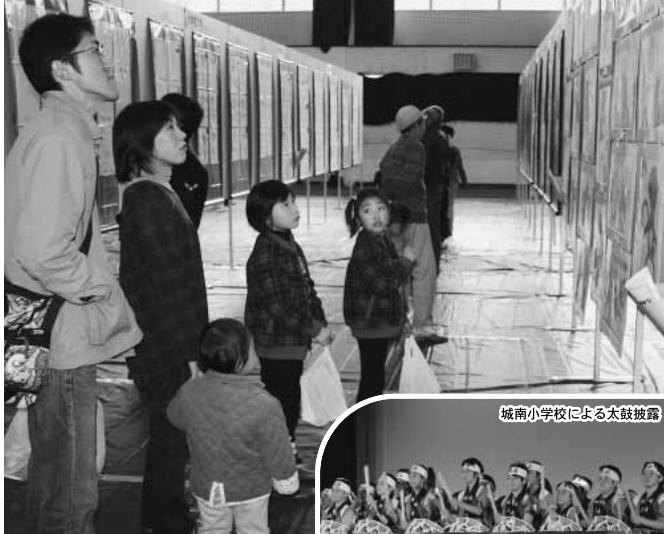
展示会場にもたくさんの家族が訪れました