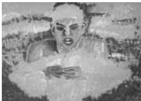
←【小学生の部】鷹山賞 「じょうずにできたぜ!! 平泳ぎ」 (水彩)