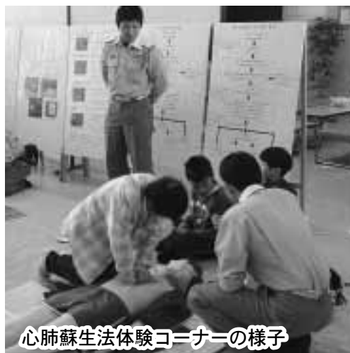
心肺蘇生法体験コーナーの様子