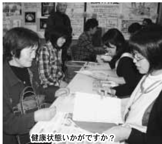
健康状態いかがですか？