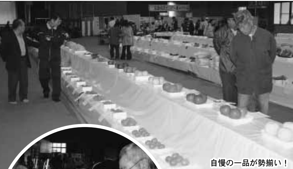
自慢の一品が勢揃い！

また、10月25日に行われた「七戸駅発！ふるさと駅弁一品料理コンテスト」で入選した「長芋羹（ながいもの羊かん）」「青森シャモロック照り焼き」「南部とる飯」のレシピが、まつり期間中、会場内の特設ブースに設置され、実際に試作した作品を関係者らが振る舞うなど、間近に迫った東北新幹線七戸（仮称）駅開業をPRし、集まった来場者らは関心を寄せているようでした。