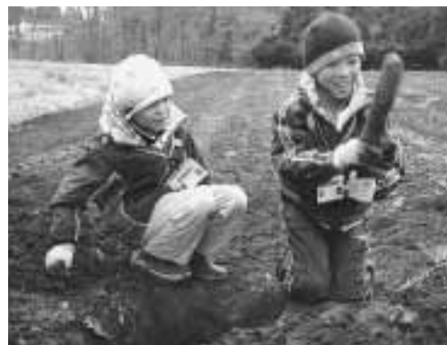
ながいも掘れたよ！