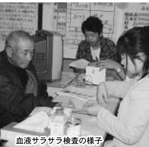
血液サラサラ検査の様子