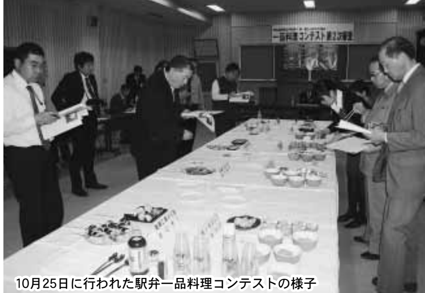
10月25日に行われた駅弁一品料理コンテストの様子