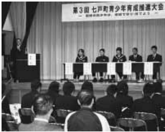
会場の参加者を巻き込んだパネルディスカッション