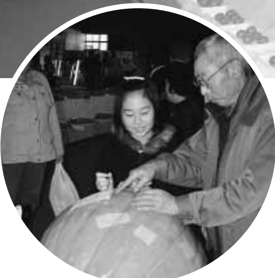
かぼちゃのおもさどれくらい？

11月3日、4日の2日間「第3回七戸町産業文化健康まつり」が開催され、家族連れなど多くの来場者で賑わいました。主会場である中央公園では、35店舗が軒を連ねる商工まつりや、野菜即売会などの農林畜産まつり、愛好者が舞台で華麗に舞う文化まつりなど、多彩な催し物が行われ、七戸体育館では、自慢の作品を展示し、色鮮やかな作品で来場者を楽しませました。