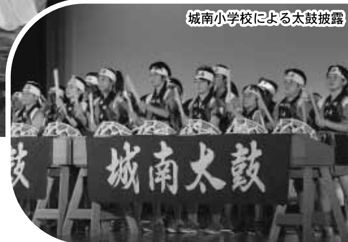
城南小学校による太鼓披露