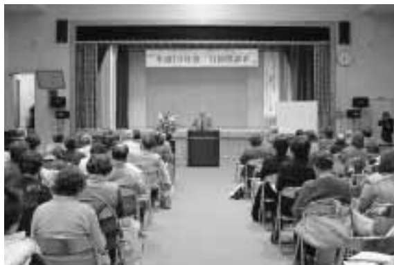
新妻二夫氏による講演の様子

平成19年度の生涯学習講座、南公民館講座の閉講式が12月11日、柏葉館で開催され、受講生52人、各講師10人が参加しました。