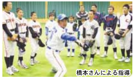
橋本さんによる指導