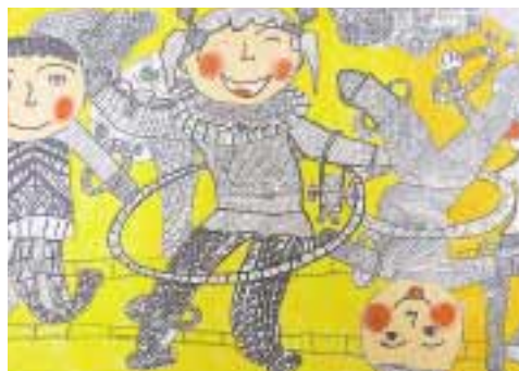
←「キッズ・アートワールド大連2007」出品作品から