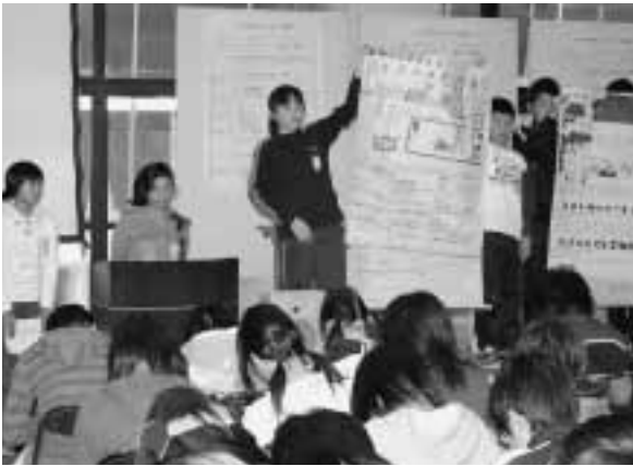
各クラスでまとめたアイデアを発表

大人では考えつかないようなユニークなアイデアなどが飛び交うと、会場の子どもたちも目を輝かせながら、将来の七戸町について真剣に考えていました。