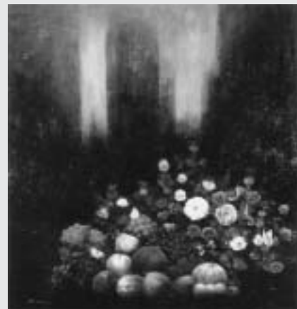
▲平成20年度購入七戸町美術資料 鷹山宇一油彩画「夜明けの静物」(1990年) 只今公開中!是非ご鑑賞ください