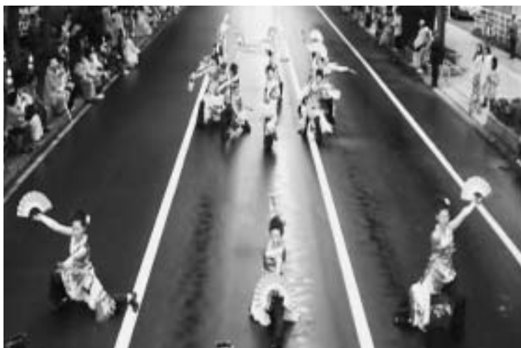
大通パレード会場（南コース）