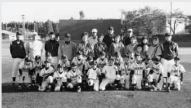
第3位に輝いた 天間西小学校