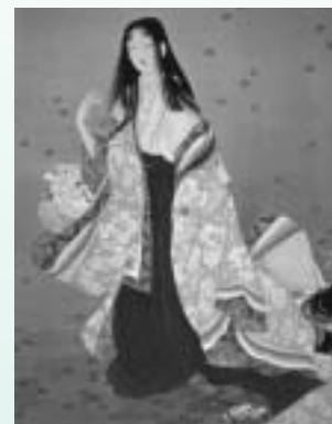
▲上村松園「花がたみ」

特典:参加賞として東北新幹線七戸十和田駅と新型車両 E-5 系イラスト入りオリジナル缶ドロップ(非売品)を進呈。