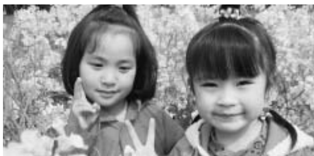
ミツバチ ブーン ブーン ちょっぴりにがわらい