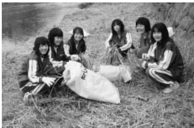
七戸中学校の生徒も笑顔で作業に励みました。