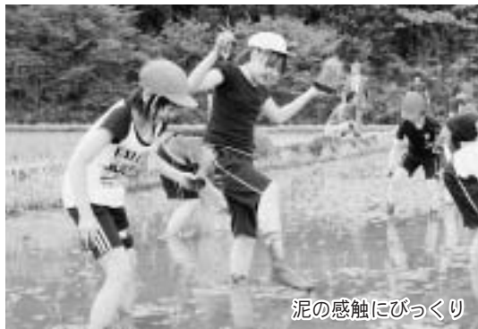
泥の感触にびっくり