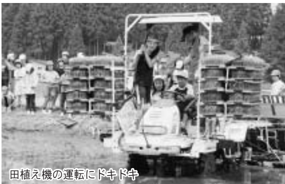
田植え機の運転にドキドキ

はじめに児童たちは昔ながらの手植えに挑戦。初めての泥の感触に歓声を上げながら、1反