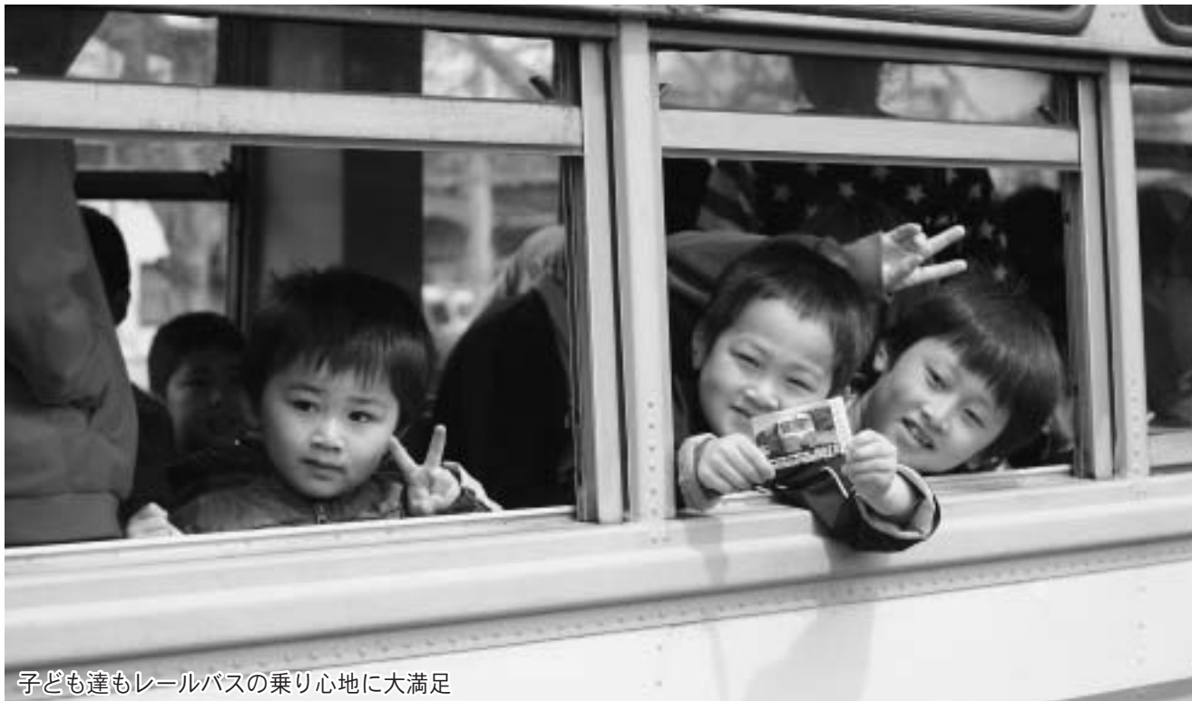
子ども達もレールバスの乗り心地に大満足