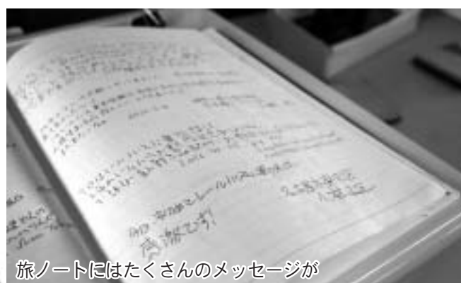
旅ノートにはたくさんのメッセージが

※『鉄道むすめ』はトミーテックが展開する、全国の鉄道事業者の制服を着たキャラクターです。