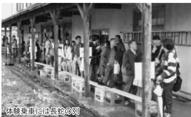
体験乗車には長蛇の列