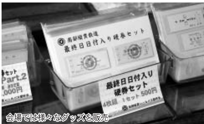
会場では様々なグッズを販売