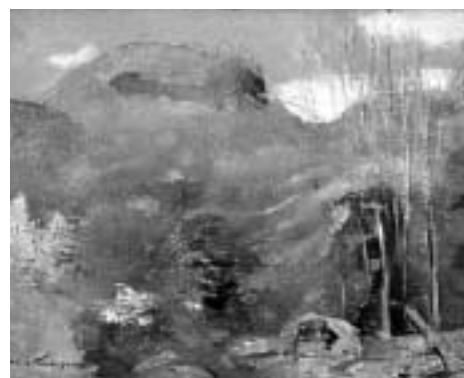
④金山平三「紫明仙(春)」(油彩・カンヴァス)