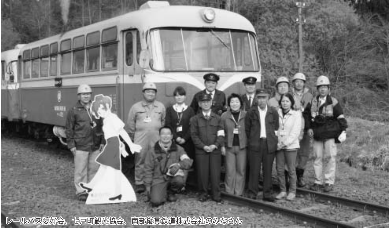
レールバス愛好会、七戸町観光協会、南部縦貫鉄道株式会社のみなさん