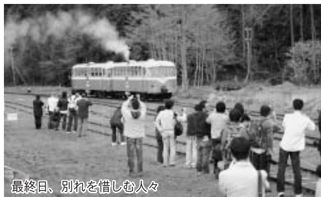
最終日、別れを惜しむ人々