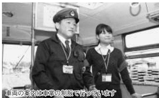
車両の案内は車掌の制服で行っています