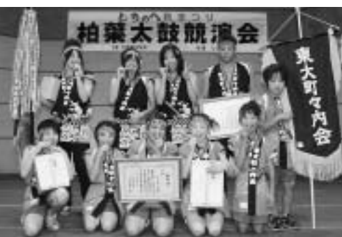
柏葉太鼓競演会優勝 東大町町内会