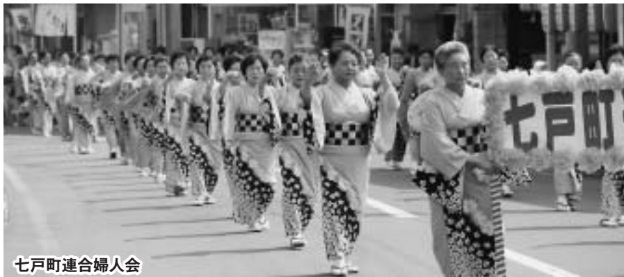
七戸町連合婦人会