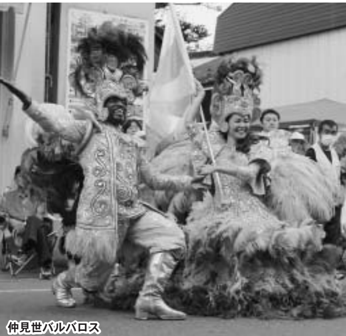
仲見世バルパロス