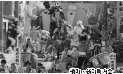
横町・袋町町内会