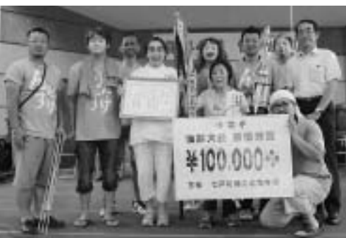
仮装大会最優秀賞 明照保育園

毎年恒例の「しちのへ秋まつり」が9月6日から9日までの4日間、七戸中央商店街を中心に開催され、町内外から大勢の家族連れや観光客が訪れにぎわいました。 前夜祭では、イベント広場で「柏葉太鼓競演会」が行われ、14町内から選ばれた小中高生が、太鼓の囃子を互いに競い合いました。審査の結果、大太鼓の部で部門賞を獲得した東大町町内会が3年連続優勝を果たしました。 初日と最終日には、神輿・山車合同運行が行われました。神輿に続いて、17町内会の豪華絢爛な山車が披露され、まつり囃子を響かせながら商店街を練り歩きました。 中日は、七高生による「トラジヨサンバ」や連合婦人会、てんま夢創会による流し踊りが披露された後、七戸町商工会青年部主催の仮装大会が行われました。仮装大会には11チームが出場し、ユニークなパフォーマンスで沿道の観客を楽しませていました。また、夜には山車の合同運行も行われ、ライトアップされた山車は昼間とは違った表情を見せていました。 まつり期間中は、様々な催し物や多くの露店で賑わい、訪れた観客らは、まつりのお囃子とともに七戸の秋を満喫していました。