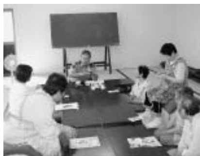
天間林駐在所の所長による安全講話

同教室は介護予防教室として石沢集会所で実施(今年度より天寿園に委託)しています。参加者の「何か自分達にできるボランティアはないか」という思いから、交通安全キャンペーンに取り組み3年目となりました。当日会員は、石沢集会所の前を