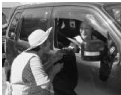
「安全運転よろしくお願ひします」と呼びかけてマスコットを配布しました

通るドライバーに、手作りマスコットを配布し、皆さんに笑顔で受け取っていただくことができました。