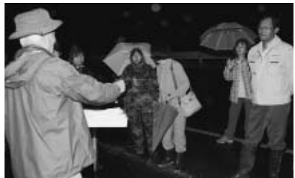
ヒナコウモリの専門家を呼んで、ヒナコウモリ観察会が行われました。

100人会議で一番人気だったのが、この「ドラキュラまつり」です。七戸町の特産品である「にんにく」と天間館神社で繁殖している「ヒナコウモリ」を掛け合わせ、まちづくりにつなげようとしています。現在、実行委員会を中心に話し合いを重ねています。まず、第一歩として8月3日にヒナコウモリの観察会が行われました。今後、ドラキュラを用いたまちおこしに向けた取り組みを企画していく予定です。