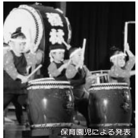
保育園児による発表