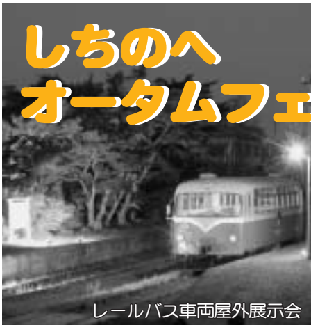
レールバス車両屋外展示会