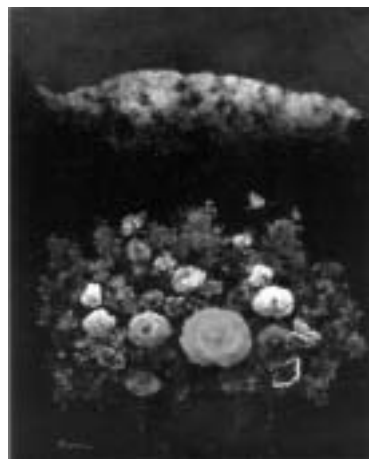
「早春賦」1990年 キャンバス・油彩