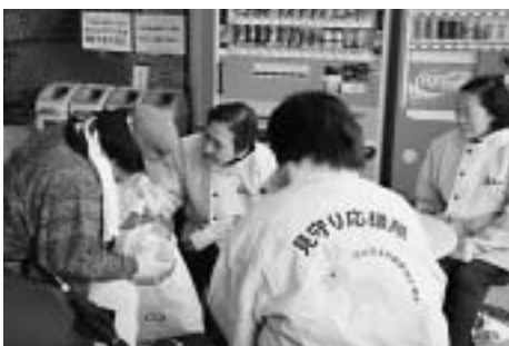
見守り応援隊ジャンパーを着用し、やさしく声をかける参加者。

12月21日、認知症高齢者が安心して暮らせる地域づくりを目指し、徘徊者への対応や声掛け等の接し方を学ぶ模擬訓練が中央公民館で実施されました。訓練には、民生委員やほのぼのの協力員ら約30人が参加。